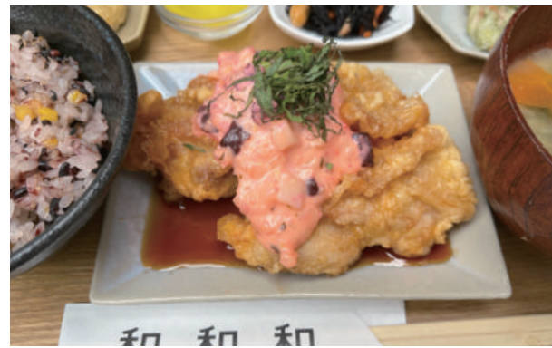
月 チキン南蛮 Chicken nanban 一四〇〇円