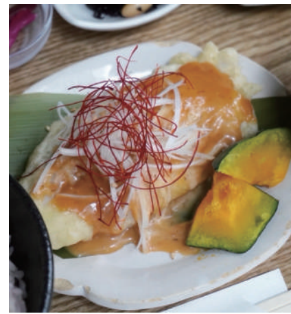
い 白身魚の 味噌マヨネーズ White fish miso mayonnaise 一四〇〇円