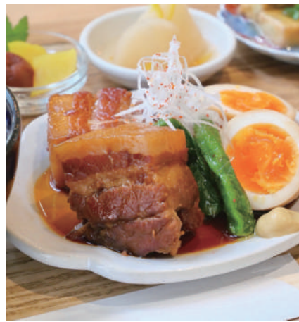
ろ 豚の角煮 (数量限定) Soy-Braised Pork 一六〇〇円