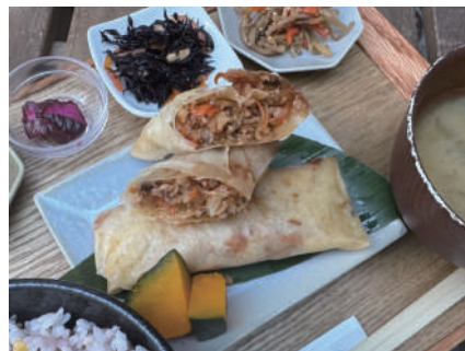
木 五目春巻き Gomoku spring rolls 一四〇〇円