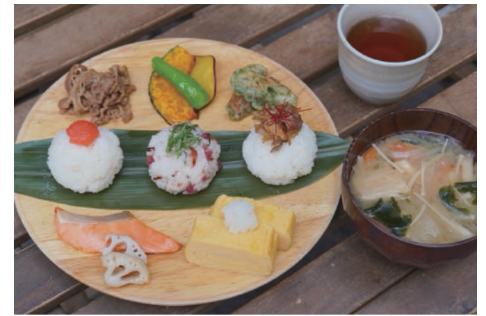
朝のおにぎり定食 morning rice ball set ※季節によりおにぎりの具や お惣菜の種類が変更になります。 一、一〇〇円