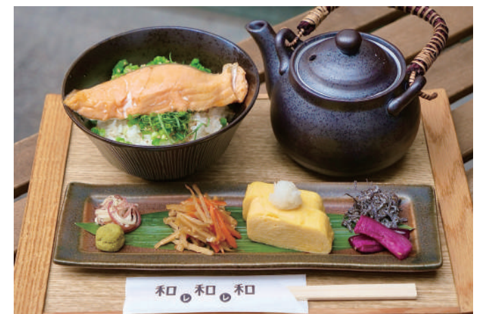
出汁茶漬け【鮭】 Dashi Chazuke [Salmon] 一五〇〇円