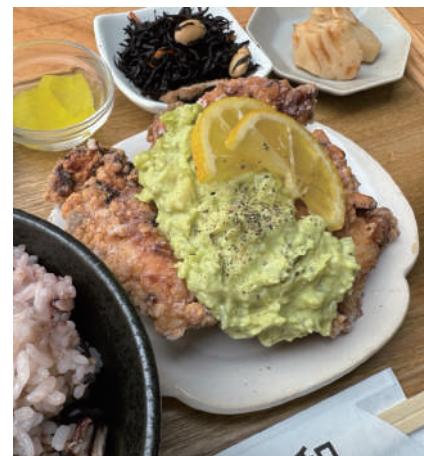
は ワカモレ からあげ Guacamole fried chicken 一四〇〇円