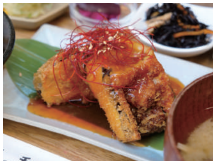
金 茄子のはさみ揚げ Fried eggplant with scissors 一四〇〇円