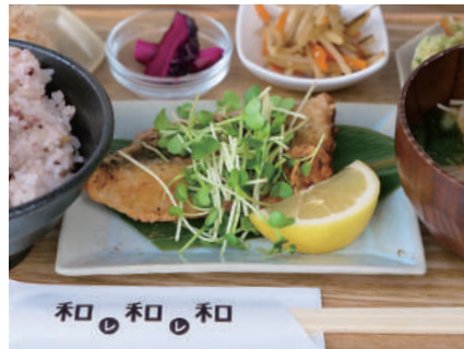
火 白身魚の 山椒竜田揚げ white fish Deep-fried Sansho Tatsuha 一四〇〇円