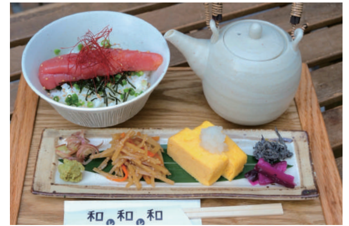
出汁茶漬け 【辛子明太子】 Dashi Chazuke [Karashi mentaiko] 一五〇〇円