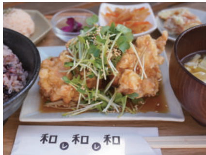
水 和風油淋鶏 Japanese style fried chicken 一四〇〇円