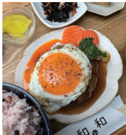
に 照り焼き ハンバーグ Teriyaki hamburger 一四〇〇円